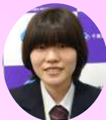
情報処理科3年 Mさん

中学生の皆さん、いろいろなことに挑戦して、学びたいことに向かって精一杯頑張ってください。