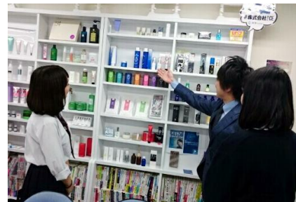
企業と商品開発の打合せ中

商業科3年生の課題研究の授業では、「模擬株式会社(12社)」を設立し、商品開発から営業広告宣伝、販売実習、利益処分まで学びます。学校(西千葉)付近の「ゆりの木商店街」のお店で生徒の考えた商品の製造をお願いし、今年は、期間限定ではありますが、パティスリー「ポナパルト」店内にて販売実習をさせていただきました。毎年、地域の皆様には、沢山の力を貸して頂いています。