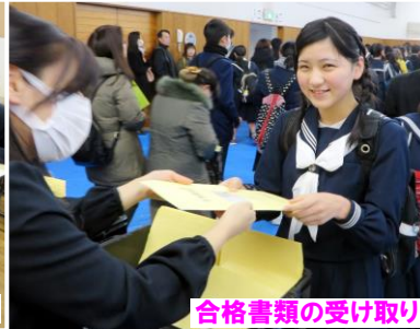
合格書類の受け取り